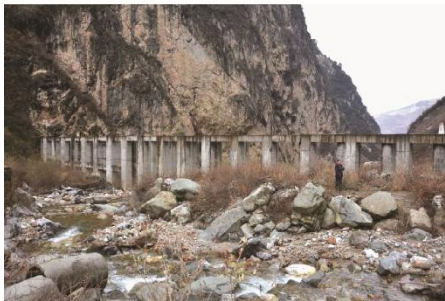
(c) 汶川七盘沟桩梁组合结构