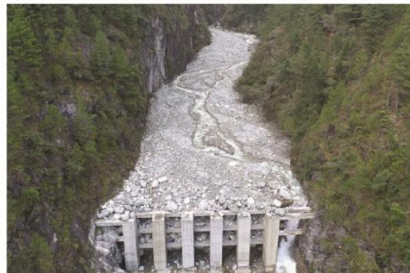
(d) 西藏波密县古乡沟桩梁组合结构