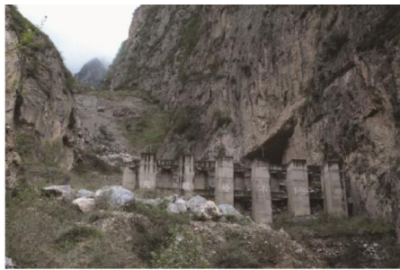
(a) 甘肃舟曲泥石流桩梁组合结构