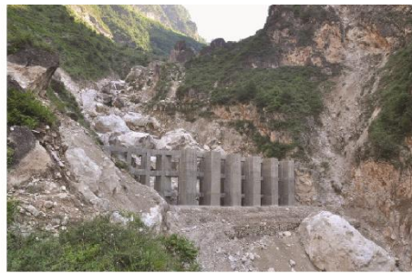
(b) 鲁甸龙头山镇泥石流沟桩梁组合结构