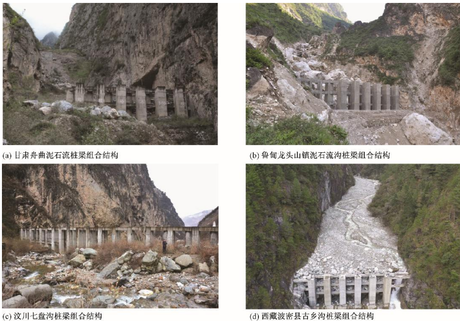
图 1 桩梁组合结构